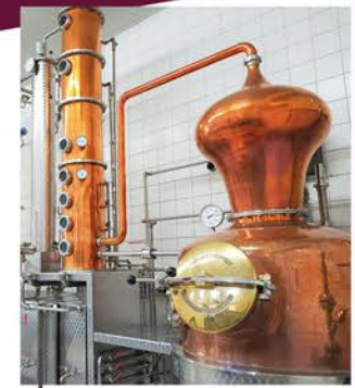
La salle de distillation avec ses alambics en cuivre martelé.