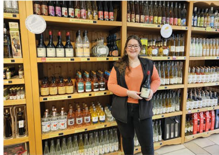
Accueil chaleureux et convivial. Dégustation libre.