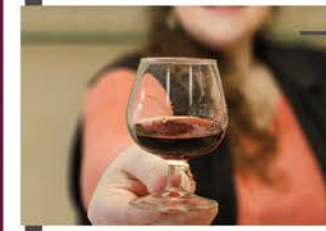
La visite s'achève par une agréable dégustation de nos produits dans la boutique. C'est le rendez-vous de la convivialité !