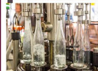
La salle de mise en bouteilles où nos 2 groupes d'embouteillage fonctionnent au rythme des commandes.