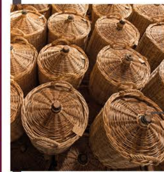
Les 3 superbes greniers de vieillissement où reposent 1200 bonbonnes d'eaux de vie dans le calme et la sérénité