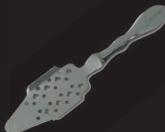
Cuillère à absinthe inox gravée Libertaine®