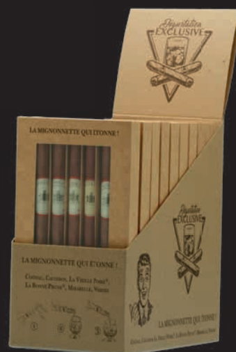
Présentoir de 10 coffrets de 5 cigares

Placez le présentoir sur votre comptoir, près de la caisse... pour un achat Coup de Cœur