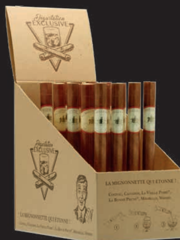
Présentoir pour 20 cigares à l'unité assortis