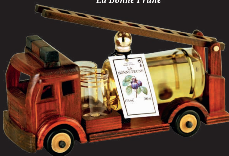
Camion pompier avec La Bonne Prune®