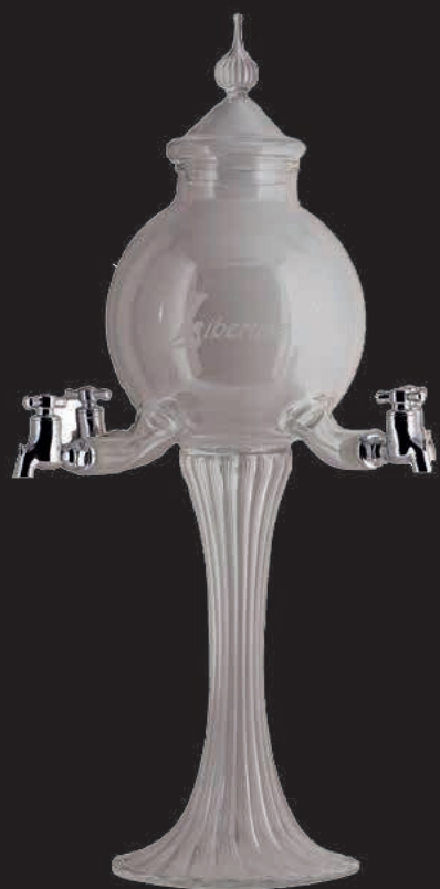
Fontaine 4 robinets Libertaine®