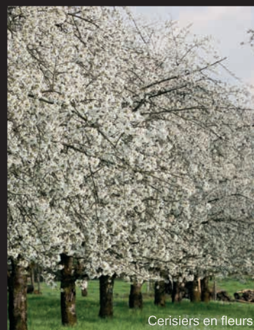
Cerisiers en fleurs