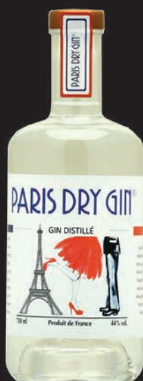
Paris Dry Gin®