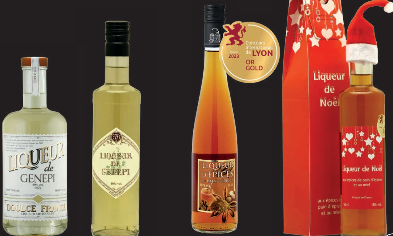
Liqueur de génépi