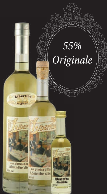
Libertine® 55% en 70cl, 20cl et 5cl