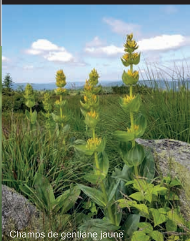
Champs de gentiane jaune