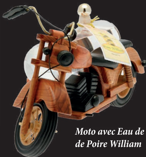
Moto avec Eau de Vie de Poire William