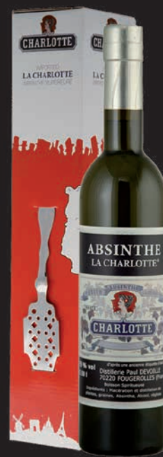
La Charlotte aux plantes d'Absinthe® 55% + étui + cuillère