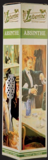
Étui pour gamme Libertine® 70cl + cuillère

Coffret Libertine® disponible en 55%, 60% et 72%