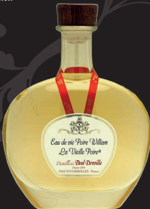
Carafe Hélios 70cl

La Vieille Poire® est élaborée à partir de poires williams spécialement sélectionnées pour leur parfum exceptionnel.