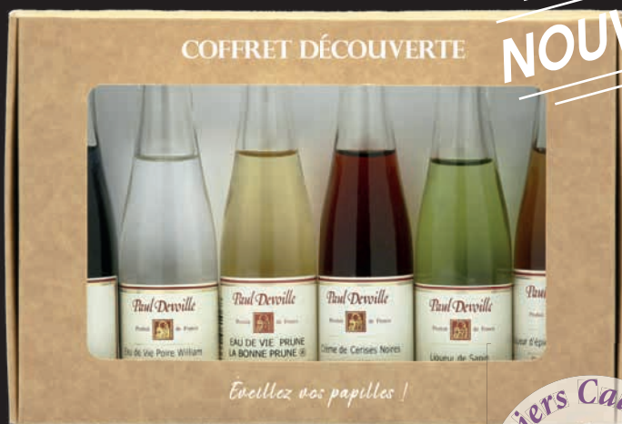
Coffret découverte de 6 mignonnettes