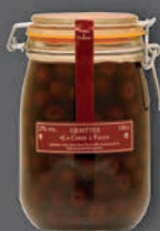
Griottes à la liqueur