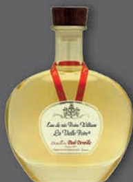
La Vieille Poire®