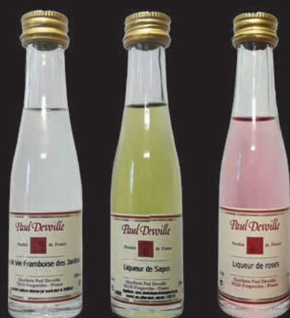
Mignonnettes 3cl à l'unité : eaux de vie, liqueurs, crèmes...