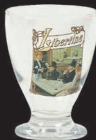
Verre Libertaine® sérigraphié