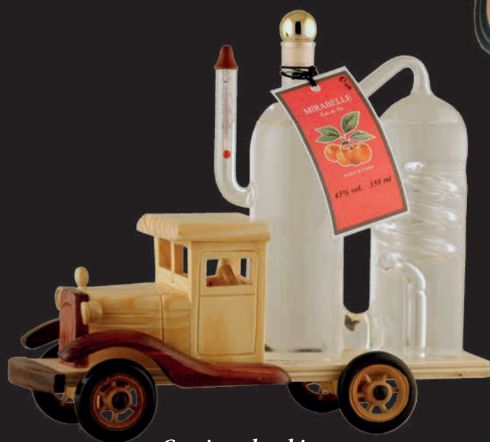
Camion alambic avec eau de vie de Mirabelle