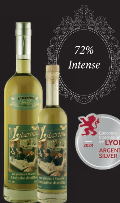
Libertine® 72% en 70cl et 20cl