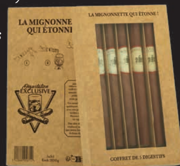
Le coffret de 5 cigares assortis