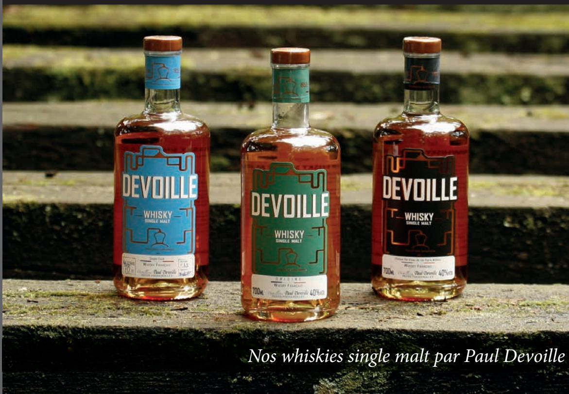
Nos whiskies single malt par Paul Devoille

Eaux de vie - Liqueurs - Crèmes - Amers Fruits à la liqueur - Absinthes - Gins - Whiskies