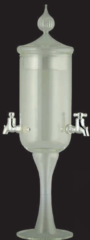
Fontaine 2 robinets