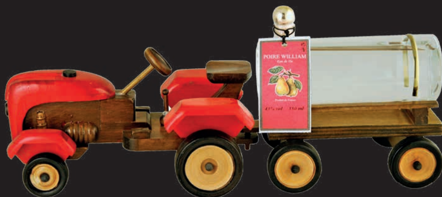
Tracteur avec Eau de Vie de Poire William