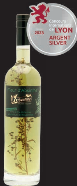
Libertine® 60% Fleur d'Absinthe® avec un brin d'absinthe