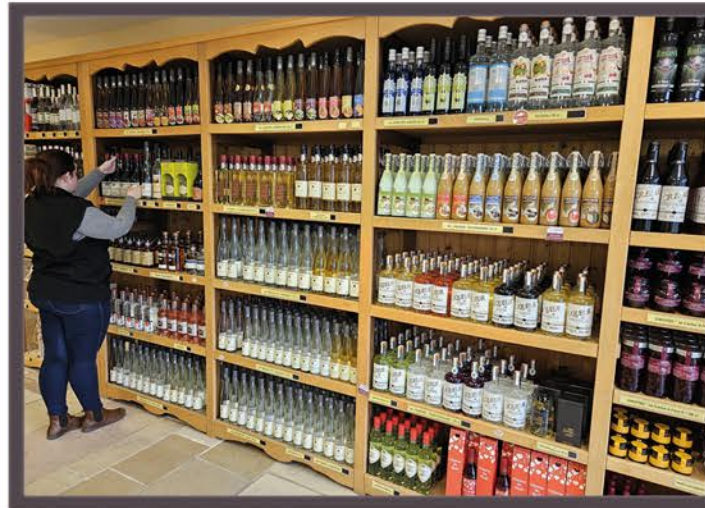
Moyens de paiement acceptés : Carte bancaire, chèque, espèces en Euros.